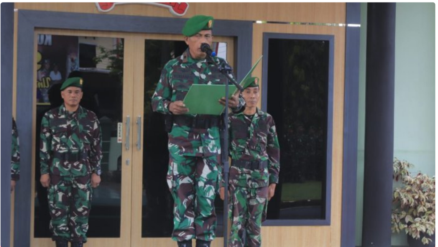
Makna Upacara Bendera Merah Putih Dibulan Suci Ramadhan Bagi Prajurit Kodim 1006/Banjar

MARTAPURA - Bagi Prajurit TNI AD Upacara Pengibaran Bendera Merah merupakan suatu keharusan dilaksanakan.